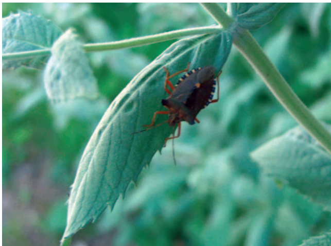
Bemat pudent de bosc ( Pentatoma rufipes ) sobre menta boscana ( Mentha longifolia ) a la Font del Deport

L'enginyer visqué al pou de gel fins el 1910, any en que s'acabà de construir la casa forestal de la Pena (3400 m / 1 h 10 min). Si s'hi accedeix, es veuen les terrasses de l'antic viver de planter forestal i una gran varietat d'arbres autòctons i exòtics plantats cap als anys seixanta. Entre els exòtics destaquen les sequoïes, els pinsaps, els làrlixs, les pícees i diferents espècies de cedres, xiprers i avets.