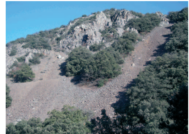
Tarteres als vessants del Mata-rucs