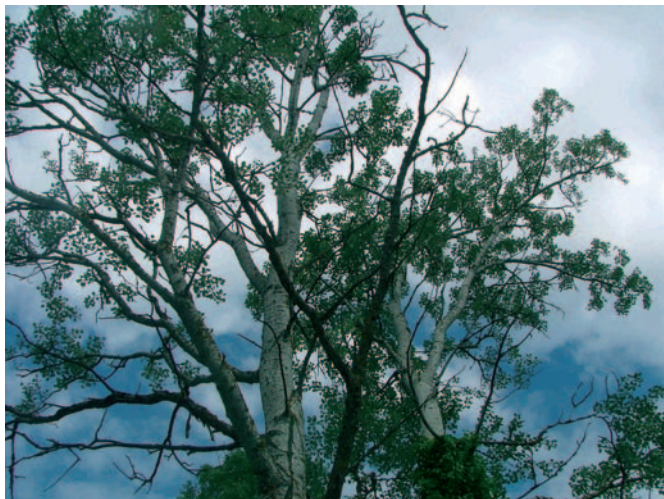
Àlber ( Populus alba )

A la Font de la Magnèsia s'inicia un recorregut que va ser un dels primers itineraris de natura senyalitzats a Catalunya. En aquest punt s'hi troba el barranc de Sant Bernat amb una vegetació de ribera típica de cursos d'aigua. S'hi veuen àlbers ( Populus alba ), freixes ( Fraxinus angustifolia ), pollancrees ( Populus nigra ) i oms ( Ulmus minor ). Precisament el nom de Poblet prové del llatí populetum , que significa bosc d'àlbers o albereda.