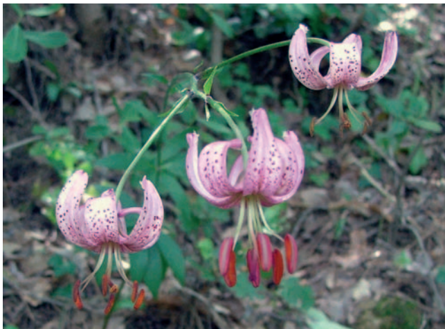
Marcòlic ( Lilium martagon )

Es continua per la pista fins a la font del Deport o Albaport (3700 m / 1 h 15 min). L'origen d'aquesta font, junt amb les altres deus de la zona, és el contacte entre les calcàries de la cinglera i els conglomerats i gresos que formen el saldó de color vermellós que esteu trepitjant. A pocs metres, es puja pel sender fins al mirador de la Pena (4500 m / 1 h 25 min) trobant arbres típics de roureda, com el roure martinenc ( Quercus humilis ), l'auró negre ( Acer monspessulanum ), la blada ( Acer opalus ), la moixera ( Sorbus aria ), la servera ( Sorbus domestica ), el til·ler ( Tilia platyphyllos ), acompanyats pel pi roig ( Pinus sylvestris ) i la pinassa ( Pinus nigra ).