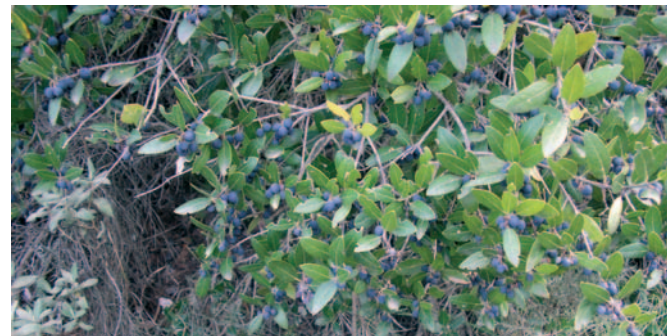
Fals aladem ( Phillyrea media )

A continuació s'entra dins l'alzinar litoral on s'observen espècies típiques d'aquesta comunitat vegetal: l'alzina ( Quercus ilex ) barrejada amb diferents pins, arbustos com ara el marfull ( Viburnum tinus ), l'arboç ( Arbutus unedo ), el fals aladem ( Phillyrea media ) o el galzeran ( Ruscus aculeatus ).