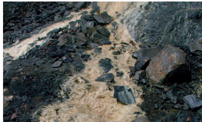
Pissarres grafitoses del Silurià

El camí continua fins a creuar el barranc, enmig de vegetació de ribera i plàtans, i s'enfila cap a l'antiga pedrera de l'Escolta (1000 m / 20 min), que juntament amb la dels Aubins i la del Pi, és el resultat visible dels antics aprofitaments que es feien a la zona. En aquest punt s'observa la textura i composició del granit que es troba oxidat (color rovell) a causa de la presència de pirita.