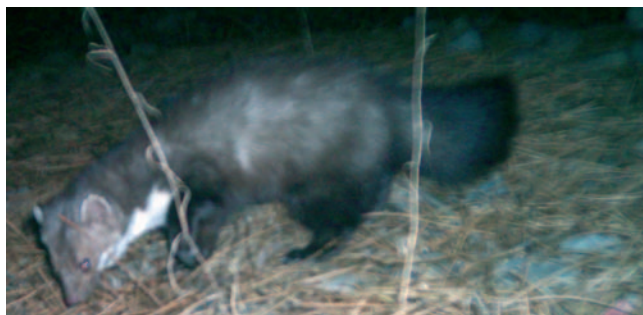
Fagina ( Martes foina )

Es pot gaudir d'unes bones vistes tant del bosc de Poblet, del monestir, com de la Conca de Barberà. En dies de bona visibilitat, és possible veure el Pirineu. Baixant del mirador i ja a la pista es passa pel costat d'unes basses que recullen l'aigua d'una cascada. Abans de l'antic pou de gel, al costat de la pista s'agafa la senda del Mata-rucs on es creuen més tarteres granítics per on de ben segur més d'un ruc carregat amb les sàrries plenes de carbó o de gel (que s'havia de transportar de nit) deuria caure per la tartera, d'aquí el seu nom. Durant la baixada es passa de l'alzinar de més altitud amb teix ( Taxus baccata ), grèvol ( Ilex aquifolium ), marcòlic ( Lilium martagon ) i diferents arbres caducifolis a un alzinar més mediterrani. Després de la senda del Mata-rucs es passa per unes pedreres abandonades i es retroba el sender de l'inici. Una vegada creuat el barranc de Sant Bernat, el camí porta fins a la Font de la Magnèsia (9200 m / 2 h 40 min) .