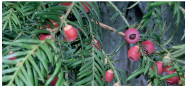
Teix ( Taxus baccata )

Es pot gaudir d'unes bones vistes tant del bosc de Poblet, del monestir, com de la Conca de Barberà. En dies de bona visibilitat, és possible veure el Pirineu. Baixant del mirador i ja a la pista es passa pel costat d'unes basses que recullen l'aigua d'una cascada. Abans de l'antic pou de gel, al costat de la pista s'agafa la senda del Mata-rucs on es creuen més tarteres granítics per on de ben segur més d'un ruc carregat amb les sàrries plenes de carbó o de gel (que s'havia de transportar de nit) deuria caure per la tartera, d'aquí el seu nom. Durant la baixada es passa de l'alzinar de més altitud amb teix ( Taxus baccata ), grèvol ( Ilex aquifolium ), marcòlic ( Lilium martagon ) i diferents arbres caducifolis a un alzinar més mediterrani. Després de la senda del Mata-rucs es passa per unes pedreres abandonades i es retroba el sender de l'inici. Una vegada creuat el barranc de Sant Bernat, el camí porta fins a la Font de la Magnèsia (9200 m / 2 h 40 min) .