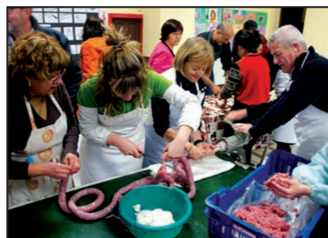
El 26 de febrer va tenir lloc un concorregut taller de mandongo a Alins, organitzat amb l'Associació pel Patrimoni de la Vall Ferrera.