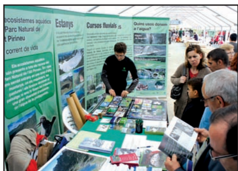
El 24 d'abril el Parc va ser present a la Fira de Natura de Sort, amb un stand compartit amb el Parc Nacional d'Aiguestortes, que va rebre moltes visites.