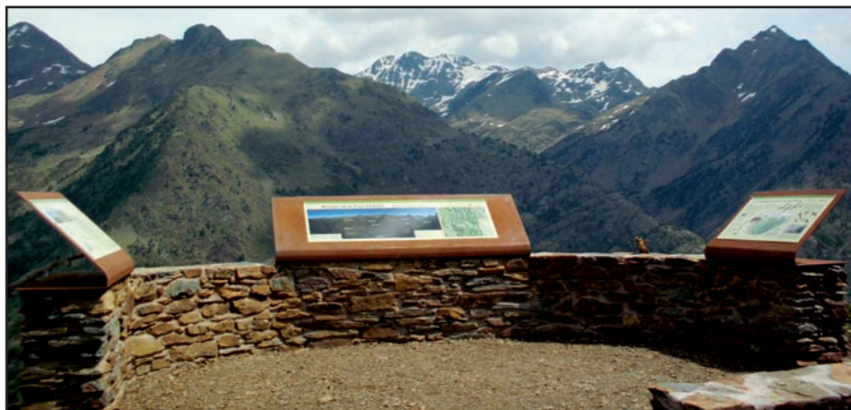
El nou Mirador de la Pica d'Estats ofereix una panoràmica accessible del sostre de Catalunya.

mat per una estructura de pedra i tres cartelleres d'interpretació del paisatge. Ara aquest indret aspira a esdevenir una visita obligada per a totes aquelles persones que volen gaudir de la Pica d'Estats en la seva estada a la Vall Ferrera.