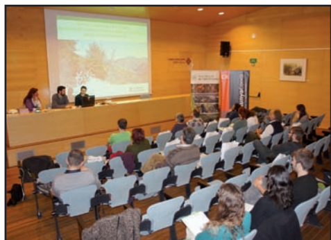
Els dies 19 i 20 de març el centre CX Món Natura Pirineu va acollir les II Jornades de la Xarxa de Voluntariat del Parc Natural.