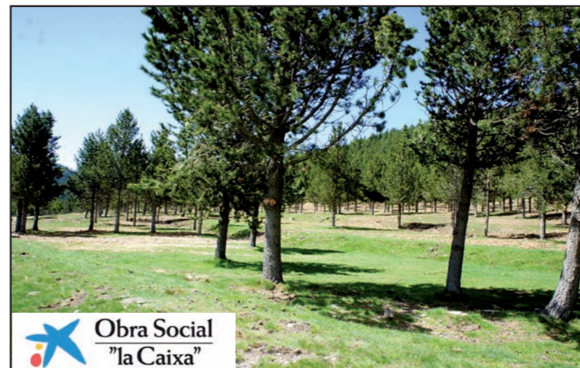
Zona d'actuació dels treballs de recuperació d'hàbitats de pastura executats a les Comes de Rubió.

Durant la tardor de 2010, el patrocini de l'Obra Social "La Caixa" va servir per executar un projecte de millora ambiental a les Comes de Rubió (TM Soriguera). El projecte, amb un pressupost de 75.000 €, ha consistit en diverses accions de dos tipus: d'una banda, s'han restaurat hàbitats de pastura mitjançant l'aclarida i poda d'arbrat en una pineda de repoblació; aquesta acció permet crear espais oberts que, a més de recuperar l'ús ramader, beneficien a diverses espècies de ratpenats forestals, uns animals beneficiosos però escassos. D'altra banda, s'ha renovat completament la fossa sèptica del refugi guardat de les Comes de Rubió, adscrit des de 2009 al Parc Natural i que tenia un sistema de sanejament que havia quedat obsolet.