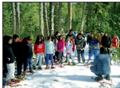
650 escolars locals han assistit un any més al programa d'educació ambiental hivernal del Parc a les estacions d'esquí nòrdic de Virós i Sant Joan de l'Erm