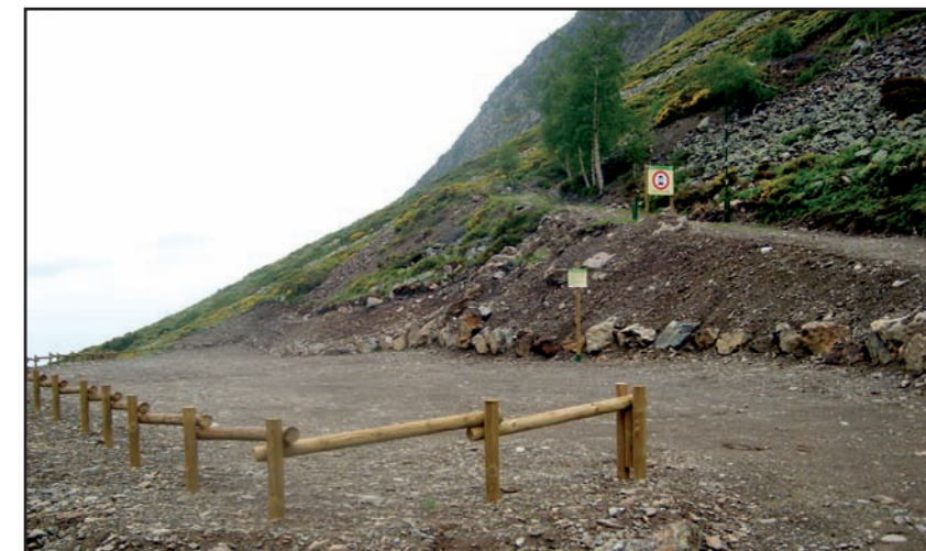
Vista del nou aparcament que permetrà ordenar l'accés al Pla de Sartari i l'estany de la Gola.

La Vall d'Unarre té un gran potencial turístic, degut en part a l'atractiu del complex lacustre format per l'estany de la Gola i els Tres Estanys, el cim del Mont-roig i la seva posició com a cruïlla de valls. Després d'arranjar diversos itineraris i de construir un refugi lliure, la col·laboració del Parc Natural amb l'Ajuntament de la Guingueta d'Àneu ha permès crear un aparcament a la pista d'accés a la Gola, mitjançant un ajut del Parc per valor de 25.800 €. Aquesta actuació permetrà reordenar la visita en aquesta zona, reduint la presència de vehicles al Pla de Sartari, un indret de gran valor paisatgístic, ramader i ecològic (molleres). A partir d'aquest estiu, els visitants podran deixar el seu vehicle en el nou aparcament i accedir a peu cap a Sartari (a 10 min.) i l'estany de la Gola (a 40 min.).