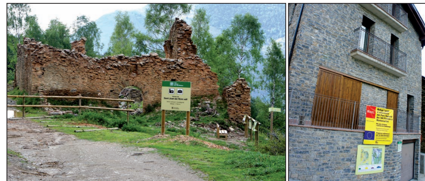
L'adequació de l'antic santuari de Sant Joan de l'Erm Vell permetrà posar-lo en valor com atractiu turístic, visitable tant des de Sant Joan de l'Erm com des del nou alberg-refugi de Montenartró, seguint els camins senyalitzats pel Parc.

En una època de crisi com la que estem vivint, aprofitar sinèrgies és imprescindible per continuar avançant. Així, aquest estiu el Parc comptarà amb dos nous punts d'informació basats en acords amb entitats privades, que gestionen equipaments públics municipals mitjançant concessions. A més de l'Alberg-refugi de Montenartró, aquest serà el cas de la Caseta de la Coma de Burg (Burg), gestionada per l'associació D'Agros. Aquests equipaments permetran millorar notablement la capacitat d'atenció de visitants del Parc sense incrementar-ne el personal contractat directament. Podreu trobar els seus horaris al nostre web.