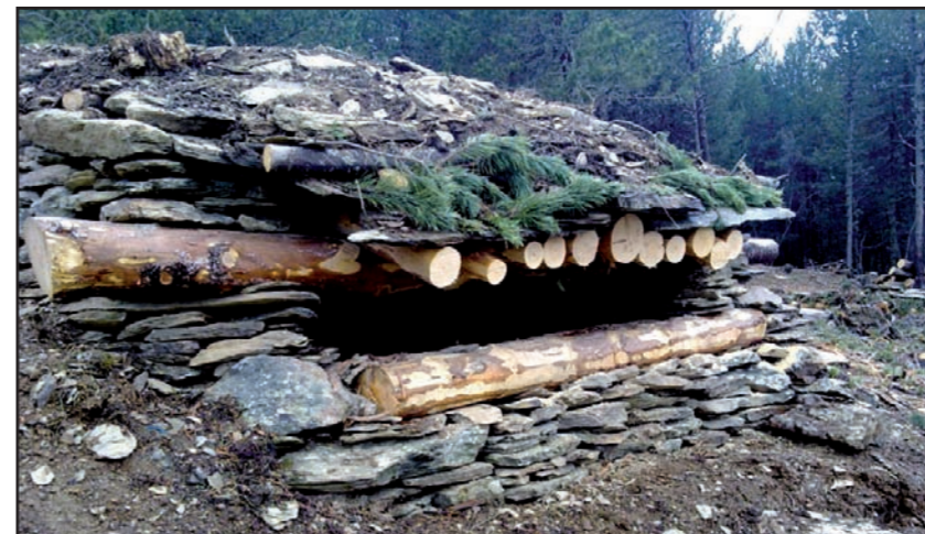
El condicionament del camí del Cuco ha inclòs la reconstrucció d'alguns búnkers i altres estructures històriques del Front del Pallars.

La Vall de Cardós va ser un dels principals escenaris del Front del Pallars durant la Guerra Civil. Ara, un nou itinerari condicionat per l'Ajuntament de Vall de Cardós amb una subvenció del Parc Natural, permet accedir al sector del Cuco des de la pista forestal d'Anàs al Pla d'Arides. Les obres, amb un inversió de 15.957 €, han consistit en la neteja del camí, la instal·lació de senyalització interpretativa i de continuïtat, i la reconstrucció d'algunes estructures militars que va ocupar el bàndol nacional (búnkers i cabanes). La zona del Cuco permet gaudir també de magnífiques panoràmiques de la zona central del Parc. L'actuació ha comptat amb la col·laboració del Memorial Democràtic.