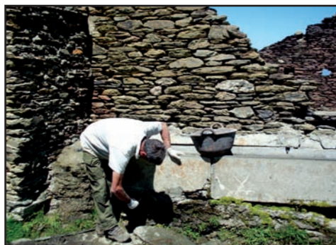
La brigada del Parc ha arranjat dos abeuradors d'ús ramader a Llavorsí, com aquest situat als Camps de Biuse.