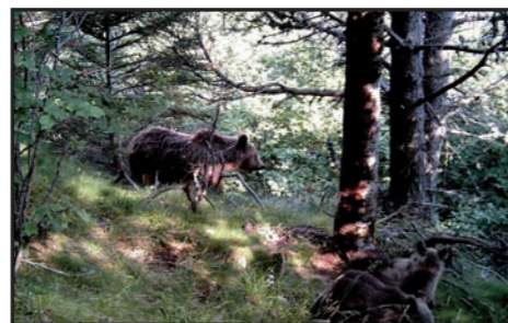
Aquest estiu les càmeres automàtiques de l'equip de seguiment de l'ós han permès identificar 5 exemplars diferents, entre els quals destaca aquesta femella amb dos cadells de l'any.