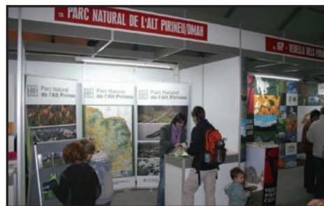
El Parc col·labora amb l'organització de fires locals, i també s'ha mantingut aquest stand a la Fira de Sant Ermengol de la Seu d'Urgell.