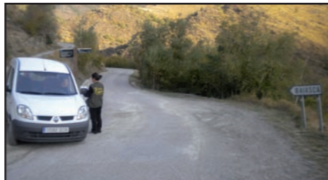
Bona part de l'estudi de freqüentació turística s'ha basat en la realització d'enquestes per saber què han fet les persones que han visitat el Parc, com aquesta a la vall de Baiasca.

les dades de freqüentació obtingudes mitjançant enquestes, per tal de valorar els canvis en el nombre de visitants del Parc.