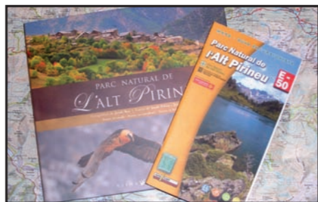
Dos noves publicacions sobre el Parc: el mapa i guia excursionista de l'editorial Alpina, i el primer llibre fotogràfic, publicat per Viena Edicions amb magnífiques imatges de Jordi Bas.