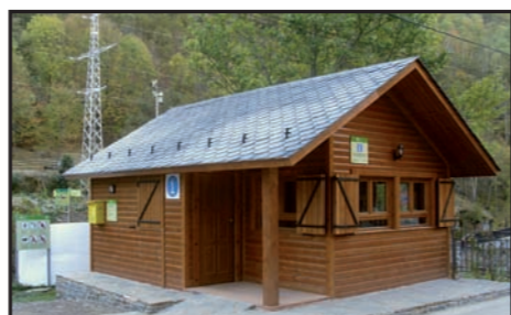
Un ajut del Parc a l'Ajuntament de Lladorre ha finançat amb 30.000€ la construcció de la nova oficina de turisme de Tavascan i Punt d'Informació del Parc a Cardós.