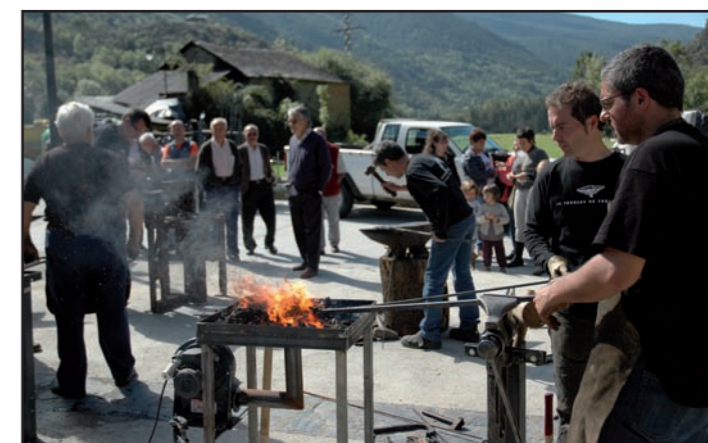
Imatges dels diferents actes vinculats a les primeres Jornades i Fira del Ferro a la Vall Ferrera (1, 2 i 3 d'octubre).