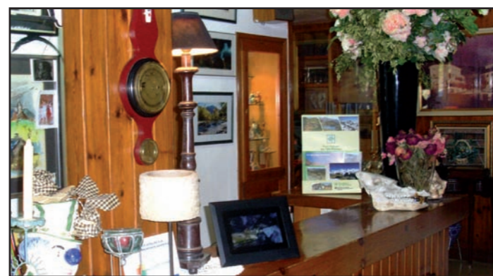
El nou expositor a l'Hotel Cardós de Ribera de Cardós.

Aquest estiu el Parc ha distribuït 77 expositors en establiments turístics dels municipis del Parc, per tal de fer-lo més visible als seus usuaris, a la vegada que es presenten ordenadament les publicacions més útils per al visitant. Els expositors són de cartró dur, mostren el logotip i algunes imatges representatives del Parc, i permeten posar-hi publicacions com l'opuscle de presentació del Parc, el mapa-guia general, el mapa-guia del sector corresponent o el programa d'activitats vigent. Aquesta iniciativa ha tingut una bona acollida entre els establiments turístics, els quals es comprometen a omplir l'expositor únicament amb material del Parc i a avisar quan s'acabin les existències per tal de reposar el material.