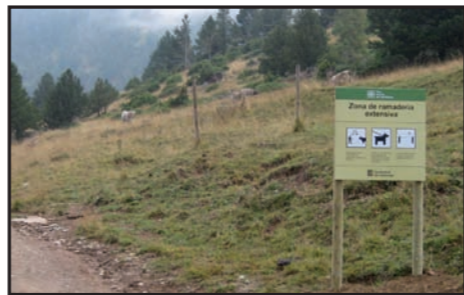
La Brigada ha instal·lat 15 cartells per informar els visitants com s'han de comportar amb el bestiar. A la imatge, cartell del Ras de Conques (Les Valls de Valira).