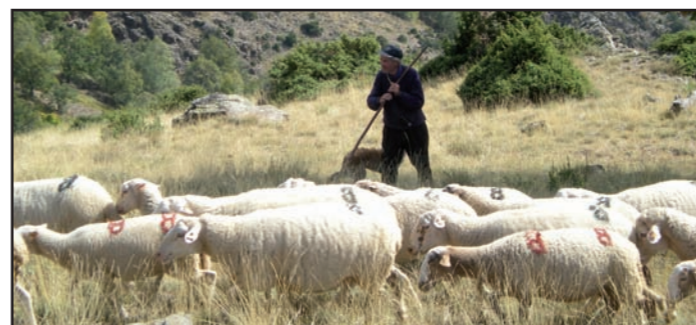
L'important treball de manteniment d'hàbitats de pastura que fan els ramaders locals, com el de la imatge de Llavorsí, compta amb el suport dels ajuts del Parc.

El passat mes d'agost el DMAH va resoldre la convocatòria d'ajuts 2010 d'espais naturals protegits de Catalunya. En aquesta ocasió, s'han atorgat 161 expedients corresponents al Parc Natural de l'Alt Pirineu, els quals representen un import total concedit de 923.641 €. D'aquests ajuts, 27 corresponen a sol·licituds d'ens locals, 108 a particulars, 15 a associacions i 11 a empreses. Una de les línies més importants, que s'ha aplicat per segon any consecutiu, és la dels ajuts al manteniment d'hàbitats oberts (prats i matollars) mitjançant la pastura. El termini d'execució de les actuacions finançades per aquesta línia finalitza el 15 de novembre de 2010.