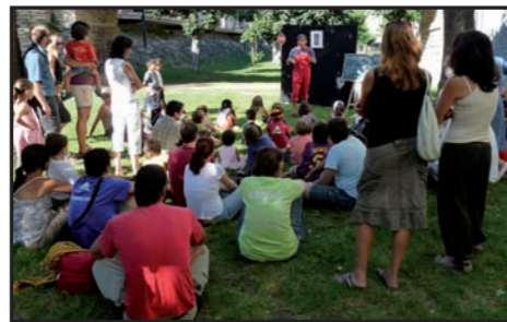
Dos noves activitats que han despertat l'interès d'un públic nombrós: demostració de l'ofici de dal·laire a Àreu (31 de juliol) i l'Nit dels Ratpenats a Sort (7 d'agost).