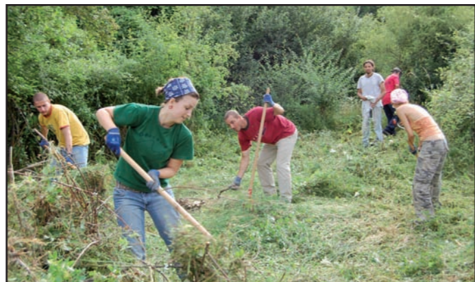
Voluntaris/es del Parc en un cens de perdiu xerra a Boldís (esquerra) i recuperació de pastures amb el camp de treball internacional del Projecte Grípià (dreta).