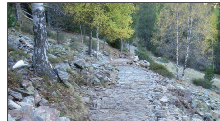
Treballs de condicionament del camí d'accés al Refugi Vallferrera.

A final de setembre s'ha començat a executar dos projectes d'inversions gestionats mitjançant l'empresa pública Forestal Catalana. A la Vall Ferrera es desenvolupen dos actuacions d'ordenació de l'ús públic, amb una inversió de 232.257 €, que permetran, entre altres, condicionar l'aparcament de la Molinassa, millorar l'accés al Refugi Vallferrera, ordenar l'entorn del Pla de Boet i millorar la senyalització del Parc en aquest municipi. D'altra banda, a la forest de les Comes de Rubió, propietat de la Generalitat, el patrocini de "La Caixa" permetrà invertir 75.000 € en accions de naturalització de repoblacions de pi negre i en la substitució de l'antiga fossa sèptica del refugi de les Comes de Rubió, actualment obsoleta.