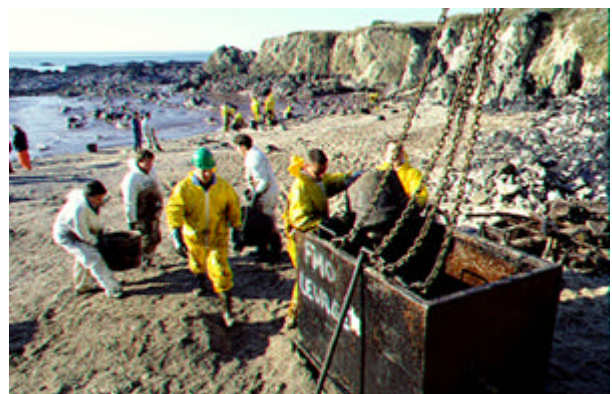
Figura A15.8 Evacuació dels residus a peu de platja