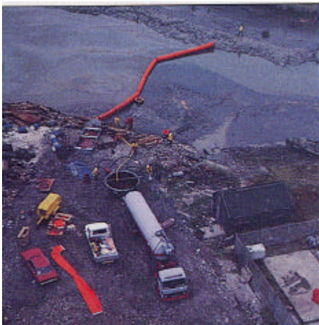
Figura A15.7 Treballs d'aspiració dels residus en la platja