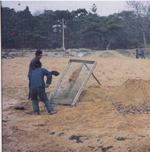
Figura A15.5 Tamisat manual. Tècnica per a petita escala per a la separació de sorra neta amb hidrocarburs (Font: technical iinformacions paper. ITOFF)