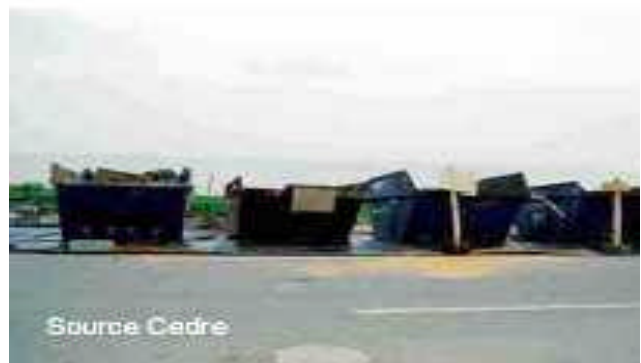
Figura A15.4 Caixes contenidores.