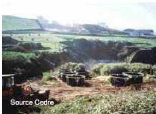
Figura A15.3 Dipòsits mòbils.