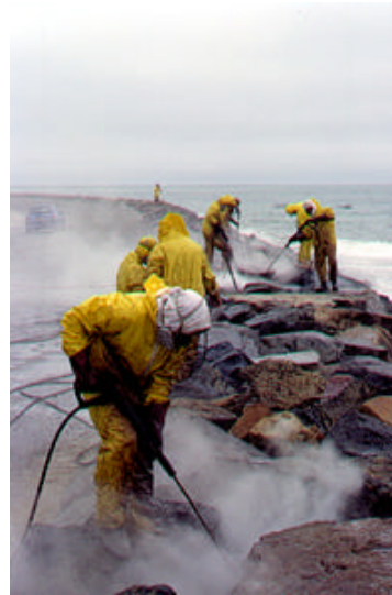
Figura A15.6 Aplicació d'aigua calenta a pressió