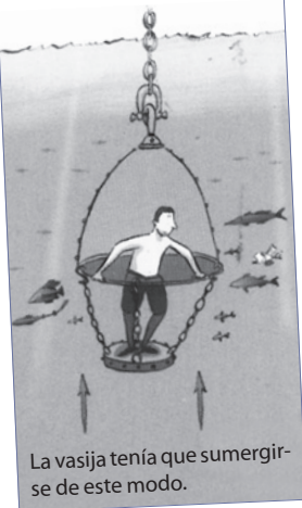
La vasija tenía que sumergirse de este modo.

Si uno se ponía de pie dentro de la vasija, podía respirar.