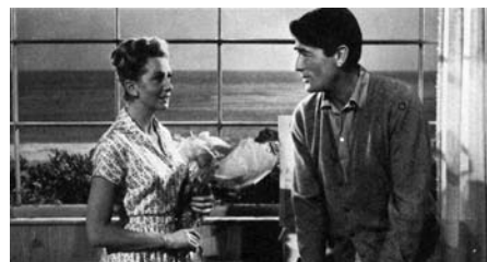
Días sin vida de Henry King