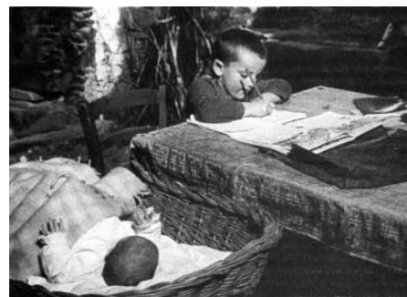
L'albero degli zoccoli d'Ermanno Olmi