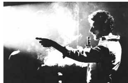
Lenny de Bob Fosse

L'adopció per part de la indústria del finançament extern va succeir de manera simultània a una diversificació creixent. Com a resultat directe de la sobreproducció i de la crisi de públic sofertes durant els anys seixanta, cap al final de la dècada, tots els estudis excepte 20th Century Fox, Columbia i Disney havien estat adquirits per conglomerats. (Tot i això, ja l'any 1954 tant Columbia com Disney s'havien diversificat pel seu compte tot introduint-se en el camp de la producció televisiva. Encara més, Disney fou una pionera industrial en mercats secundaris com ara els parcs temàtics i els productes de marxandatge). Començant per l'adquisició d'Universal per part de MCA l'any 1962 i continuant amb la venda de Paramount a Gulf & Western Industries l'any 1966, la de United Artists a Transamerica Corporation l'any 1967, la de Warner Bros a Kinney National Service Corporation i la de MGM al financer de Las Vegas Kirk Kerkorian l'any 1969, els estudis van ser absorbits un per un per companyies més grans i més diversificades per a les quals representaven una bona inversió gràcies a la devaluació temporal de les seves accions i al fet que pos-