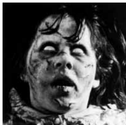
The Exorcist de William Friedkin