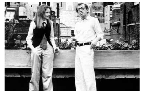
Annie Hall de Woody Allen

El New Hollywood —o el Hollywood postclàssic—és un terme que fa referència al breu espai de temps que va, a grans trets, des de BONNIE AND CLYDE i THE GRADUATE (ambdues de l'any 1967) fins a ONE FROM THE HEART (1982), quinze anys durant els quals va sorgir, es va desenvolupar i es va destruir una generació de cineastes que van canviar dràsticament la indústria de Hollywood, tant en la manera com es realitzaven i comercialitzaven els seus productes (pel·lícules) com en el seu concepte. S'ha de puntualitzar que aquells cineastes, indirectament, formaven part de l' studio system , i depenien de les majors per al finançament i la distribució de les seves pel·lícules, raó per la qual majoritàriament no eren independents, tot i que alguns sí que ho van ser als seus inicis. Sabien que sense el recolzament financer en la producció i sense el paraigües protector de la distribució i l'exhibició, les seves pel·lícules no eren res. No haurien existit, encara que només fos perquè ningú les hau-