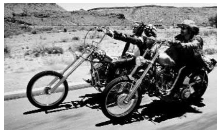
Easy Rider de Dennis Hopper

La lògica de la rendibilitat (relació cost-benefici) va propi- ciar el relleu generacional, i, tot i que els estudis fossin reti- cents a l'hora de reconèixer-ho, els cineastes es van con- vertir en autors, en directors-artistes, gràcies a l'estat d'o- pinió creat per les revistes especialitzades ( Film Quarterly , Film in Review , Cahiers du Cinéma en anglès, Films and Fil- ming , Sight & Sound , etc.), amb les quals fins i tot alguns di-