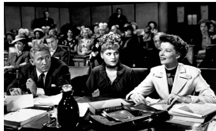
Adam's Rib de George Cukor