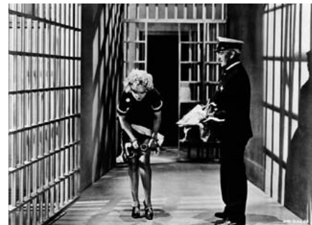
Chicago de Frank Urson