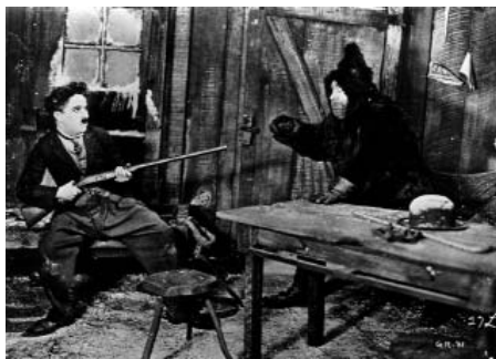
The Gold Rush de Charles Chaplin

modificar tant les condicions tècniques de rodatge com els temes de les pel·lícules. Al públic, que desitjava veure i escoltar films sonors, se li oferien obres «100% parlades». Les companyies de Hollywood s'apressaven a comprar els drets d'obres de moda i a contractar només cantants, actors de teatre la dicció dels quals no podia sinó revaloritzar-se pel nou procediment, en teoria.