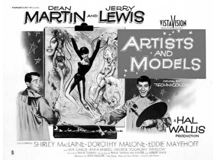
Pòster d'Artists and Models de Frank Tashlin

ra pel·lícula, MY FRIEND IRMA, va ser molt ben rebuda pel públic. Mercès a Norman Taurog (particularment a LIVING IN UP i a YOU'RE NEVER TOO YOUNG) i a Frank Tashlin, Dean Martin i Jerry Lewis es van escapar de la comicitat més convencional dels començaments per afrontar temes més interessants i més originals com ara HOLLYWOOD OR BUST o ARTISTS AND MODELS. Certament conscient de la carència dels seus directors, Jerry Lewis va acabar per esdevenir realitzador el 1960 amb THE BELLBOY. Aquesta va ser la seva oportunitat per retre homenatge als seus mestres, Laurel i Hardy, per trobar certs gags de l'època del cinema mut, i per crear una forma de comicitat molt elaborada. Preferia els universos gairebé tancats (l'hotel de THE BELLBOY, l'estudi de THE ERRAND BOY, la pensió per a joves de THE LADIES' MAN), i hi acumulava alhora gags i recerques estilístiques. Mitjançant la multiplicació del nombre dels seus personatges (THE FAMILY JEWELS), i la realització a la seva manera de la història del Doctor Jekyll i Mister Hyde (THE NUTTY PROFESSOR), Jerry Lewis va esdevenir l'home orquestra de les seves pel·lícules, de les quals, alhora, n'era el director, l'interpret, el productor, i el guionista. Paral·lelament, a partir del moment en què ja no es dirigia a ell mateix, Jerry Lewis va acceptar de ser l'heroi de films cada cop menys interessants, llevat de a THE KING OF COMEDY, d'Scorse-