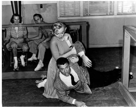
Monkey Business de Howard Hawks

Pel que fa a Dean Martin i Jerry Lewis, es van trobar el 1946 a Atlantic City. Van decidir d'associar-se per formar un duo: Dean Martin s'encarregava del cantó romàntic i Jerry Lewis dels efectes còmics. Tots dos actors van aconseguir amb rapidesa un èxit considerable tant a l'escena com a la televisió i als cabarets on es prodigaven. La Paramount els va contractar i llur prime-