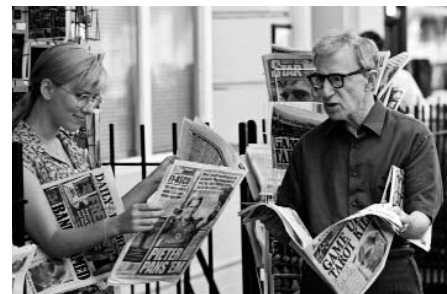
Scoop de Woody Allen

És d'aquesta manera que Woody Allen podia admetre: