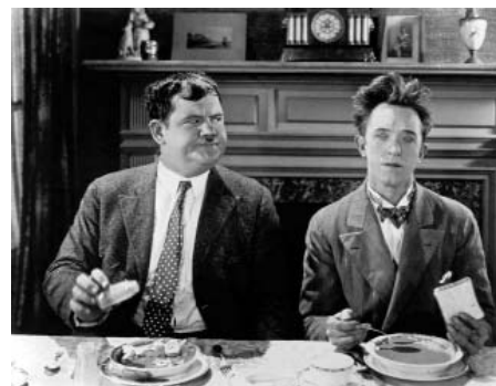
Oliver Hardy i Stan Laurel ("El Gordo y el Flaco")

tar una forma de consciència humana, tot fent denúncia tant del maquinisme i de l'automatització com del hitlerisme. Molt de temps infravalorada, LIMELIGHT (1952) va ser una de les seves obres més doloroses: l'esguard d'un home ancià sobre l'univers de l'espectacle que va ser el seu, la història dramàtica d'un vell actor que viu envoltat dels seus records, de sobte, enfrontat a l'amor i a la joventut que simbolitza la jove ballarina suïcida.