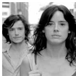
En la ciudad de Sylvia de José Luis Guerín