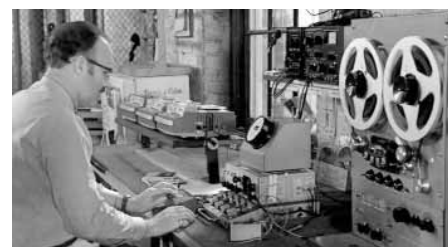
The Conversation de Francis Ford Coppola

Vaig anar a Tower Records i vaig comprar els dinou enregistraments que tenien de La cavalcada de les valquíries . Em vaig assegurar de escoltar-les amb un cronòmetre i un metrònom per veure quins enregistraments seguien apro-