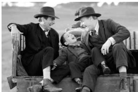
Pájaros de papel d'Emilio Aragón