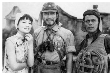
Criminal a la línia de foc de Kihachi Okamoto

Okamoto fou un dels grans d'una línia d'autors avalsats al chambara i molt crítics amb el bushido , la manera de viure del samurai i de la societat Tokugawa en general. Des d'inici dels anys seixanta, pel·lícules com ara YOJIMBO, de Kurosawa (1961), HARAKIRI, de Kobayashi (SEPPUKU, 1962), DESTINY'S SON, de Misumi (KIRU, 1962) o ASSASSINATION, de Masahiro Shinoda (ANSATSU, 1964), van deixar d'emfasitzar l'honor o l'heroisme per passar a fer-ho amb la mort i la misèria que inevitablement sobrevenen a aquells que viuen de l'espasa i a la gent amb què contacten. Les principals aportacions al gènere que Oka-