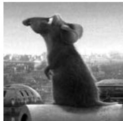
Ratatouille de Brad Bird i Jan Pinkava