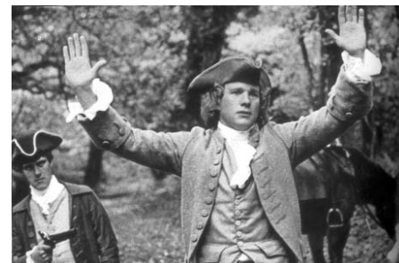
Barry Lyndon de Stanley Kubrick

Va néixer el 7 de setembre de 1924 al districte novaiorquès de Brooklyn. Les seves primeres inclinacions artístiques anaven cap a la pintura, però aviat es vinculà per sempre a les tecles del piano. Després de servir a l'exèrcit de l'aire en el decurs de la Segona Guerra Mundial, va estudiar a Califòrnia amb compositors com ara Arnold Schönberg. El seu ingrès al món del cinema s'esdevingué de la mà de tot un mite: James Dean. Rosenman escrivia música de càmera i treballava com a professor de piano a Nova York quan Dean integrà el seu alumnat i el va recomanar aferrissadament per tal que elaborés la banda sonora d'un film com ara AL ESTE DEL EDÉN (1955), un debut enlluernador que esdevindria l'inici d'una gran carrera. Paradoxalment, Rosenman aconseguiria el seu parell d'Oscars a la categoria de banda sonora adaptada (avui inexistent) per la seva tasca a BARRY LYNDON (1975) i ESTA TIERRA ES MI TIERRA (1976). Al primer títol, es va encarregar de fer l'arranjament de melodies tradicionals i peces clàssiques de Händel i Schubert, i, al segon, va treballar sobre les cançons del nord-americà Woody Guthrie, tot un mite de la cançó d'autor. Al