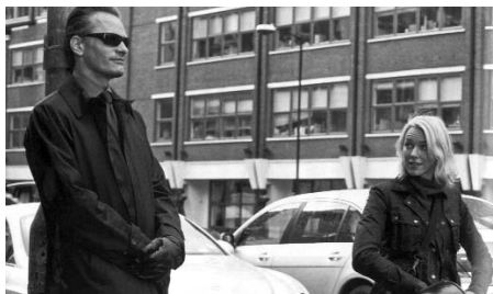
Promesas del Este de David Cronenberg