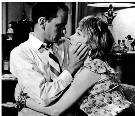
Como un torrente de Vicente Minnelli

doncs és que cada cop que voleu d'elles un amor autèntic, un amor "sincer", l'heu de pagar». Però aquesta seqüència tan dura es va arribar a rodar? Al muntatge definitiu de la pel·lícula no hi és pas, i això passa també amb la breu seqüència que la segueix, en què Dave fa una ronda pels cabarets, i sobre la qual haurien d'aparèixer els títols de crèdit sobreimpresos. D'altra banda, aquesta modificació, a banda de la supressió de dues escenes curtes entre Edith (Nancy Gates) i la seva mare (Connie Gilchrist), és l'única diferència notable entre el guió original i el resultat que es pot tenir, si exceptuem la inversió del desenllaç. Estranger a la vila que el va veure néixer, Dave Hirsch encarna, a mig camí entre la burgesia establerta de Parkman i el món dels marginats a la societat nord-americana, si-guin aquests jugadors o ganxos de clubs nocturns, la solitud de l'artista, incompres a una banda i a l'altra. La simpàtica Ginny fatiga Dave per la seva ingenuïtat i la seva manca de cultura, malgrat que aquest no està gaire més entusiasmat per les teories literàries de Gwen, que s'interessa pels autors però en tem la presència física. Contràriament als grans creadors que forja Minnelli (Jonathan Shields o Vincent Van Gogh), Dave Hirsch sembla ja un autor acabat, però aquest cansament que hauria pogut tenir el personatge es veu compensat per la interpretació admirable de Frank Sinatra, el qual desenvolupa aquí, com ara Shirley Mac Laine, el seu paper més bell.