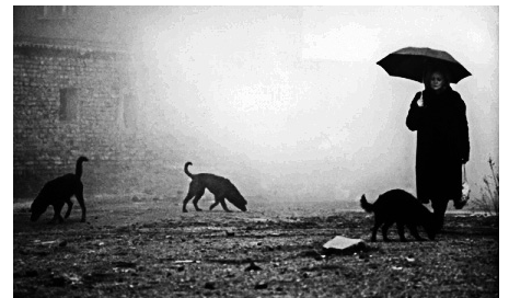
Condemnació de Béla Tarr

A la caiguda del règim socialista, amb el desmantellament parcial de les estructures que li han permès de menar un joc hàbil, els equilibris es presenten encara més difícils de controlar. És cert que, per subratllar l'esdeveniment, el director s'enfronta a SÁTÁNTANGO (EL TANGO DE SATANÀS), la