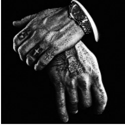
Imatge promocional de Promesas del Este de David Cronenberg