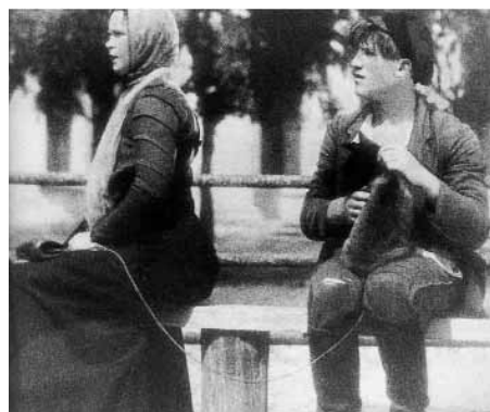
Suburbios de Boris Barnet

Finalitza el cicle dedicat a aquest estudi de l'antiga Unió Soviètica amb projeccions de films de Nikolai Ekk, Boris Barnet i Edwin Piscator. Agraïments: Cinémathèque de Toulouse i Filmoteca Española. ▶