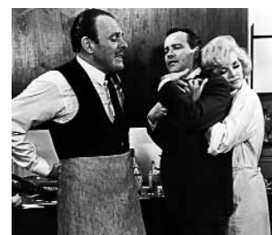
How to Murder Your Wife de Richard Quine

En aquest programa ens fixem especialment en Richard Quine, autor de comèdies elegants, però que roman molt oblidat. És clar que per elegància tenim la del gran Vincente Minnelli, amb Mi desconfiada esposa (on barreja, molt divertidament, moda i boxa). Però cal parar atenció també a exemples de comèdies incloses en altres cicles de la quinzena (com Ninotchka de Lubitsch o Bienvenido Mr. Chance de Hal Ashby). ▶