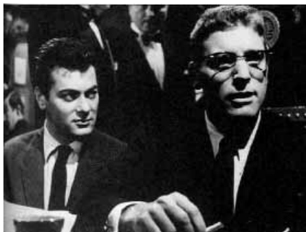
Sweet Smell of Success d'Alexander MacKendrick

Quan la vaig veure per primer cop l'any 1970, a les acaballes dels meus anys d'estudiant a l'escola de cinema, em va meravellar la seva confecció superba. Té tantes qualitats que ressalten que és difícil fer-ne una llista ordenada. El diàleg, escrit per Clifford Odets i Ernest Lehman, és excepcional, potser el discurs més enginyós i esmolat que es pugui trobar en una pel·lícula. Es desenvolupa a una velocitat i és tan ofensiu que de vegades costa creure el que hom acaba de sentir. Està ambientada a la nit de Broadway; en blanc i negre, lluent per les llums i amenaçant pels contrastos dels clarobscurs. Els carrers són plens de gent i de cotxes. Els clubs, plens a vessar de clients, gàngsters de segona fila, noies de moral relaxada i polítics corruptes. El vestuari és elegant, llampant i urbà. El treball de càmera, a càrrec de James Wong Howe, és magnífic: il·luminació mesurada, moviments ràpids de càmera, enquadrament potent i angles distintius. La major part de la pel·lícula està ambientada de nit, i fins i tot quan és de dia es pot sentir l'opressió de la