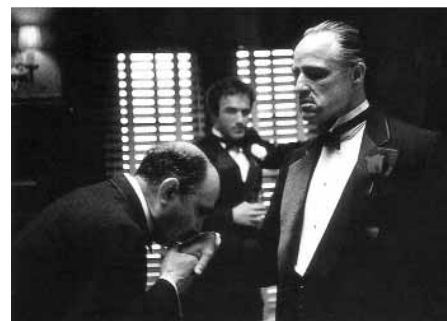
The Godfather de Francis Ford Coppola