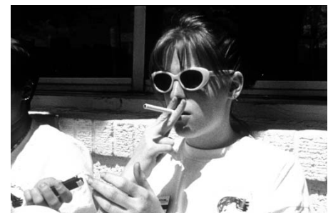
Bright Leaves de Ross McElwee

Exposant la vida. Les pel·lícules de família de Ross McElwee