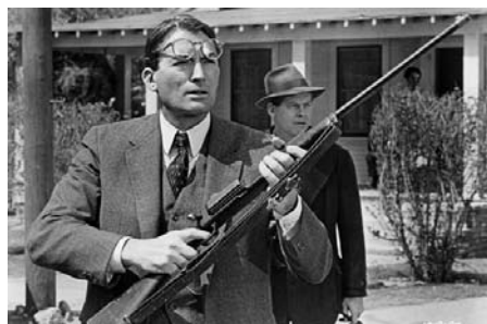
To Kill a Mockingbird de Robert Mulligan