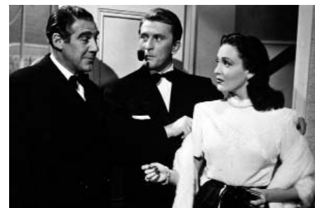
Letter to Three Wives de Joseph L. Mankiewicz

commemoració enguany del seu centenari hauria d'ajudar a compensar aquest fet. El nostre cycle s'inscriu en aquesta commemoració. I esperem que tot el públic en general, però sobretot les noves generacions, puguin tornar a fruitar d'un dels cineastes més exquisits que va sorgir a l'època del Hollywood clàssic, i que va ser guardonat amb l'Oscar per partida doble, dues vegades, atès que va rebre la preuada estatueta com a director i guionista per Carta a tres esposas i Eva al desnudo (aquesta darrera també va ser considerada la millor pel·lícula de 1950). Malauradament, la mancança cada vegada més gran de còpies ens impedeix fer-ne un cycle complet. Tanmateix, el cycle s'allargarà fins els primers dies de març. El progra-