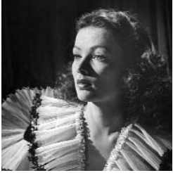
Dragonwyck de Joseph L. Mankiewicz