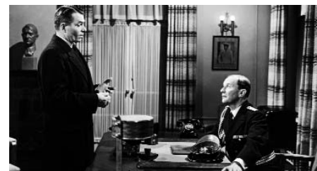
Five Fingers de Joseph L. Mankiewicz